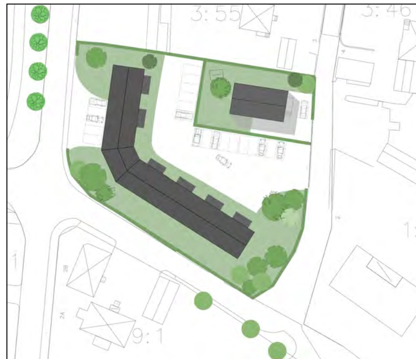
Illustrationskarta B, Harplinge 1:13