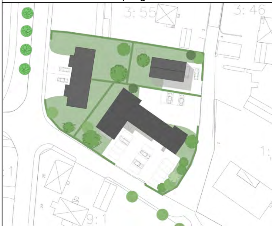
Diarienummer KS 2020/00295